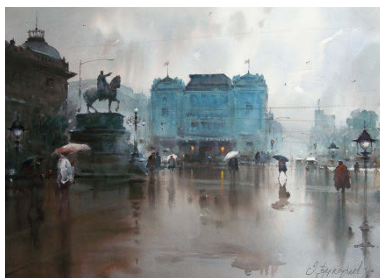
DUSAN DJUKARIC L'ATMOSPHÈRE DES SCÈNES URBAINES p. 24

VERA DICKERSON p. 56 JOUER AVEC LES TEXTURES ET LES TRANSPARENCES