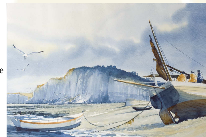
36 Démo aquarelle En quête de l'instant magique