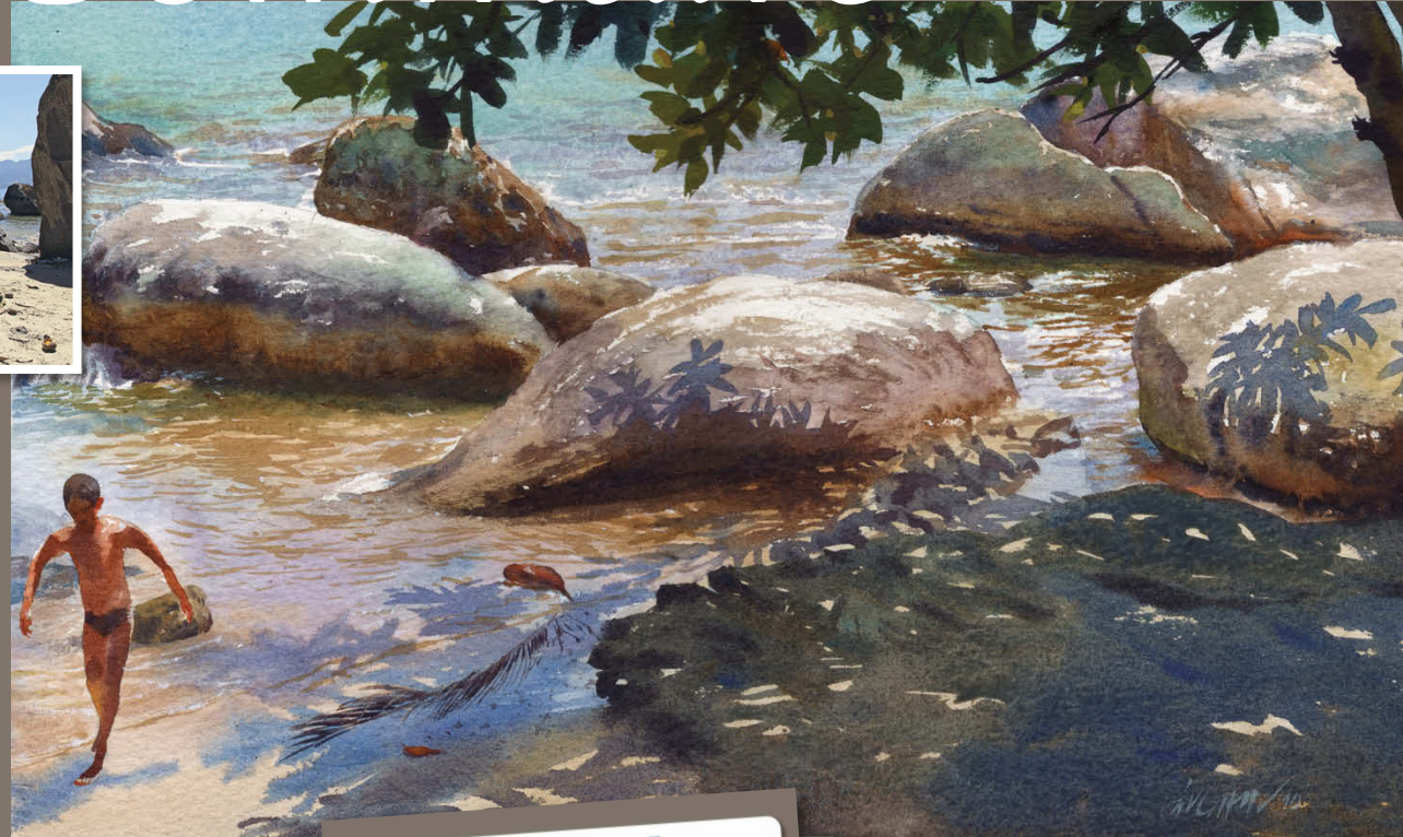
46 Gonzalo Cárcamo