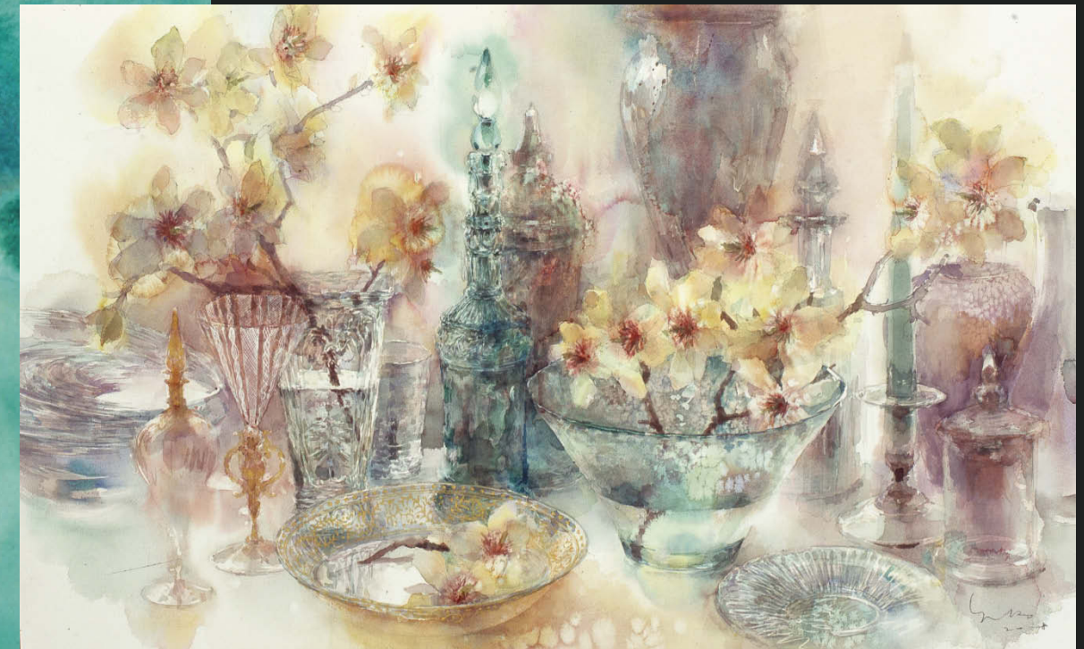
Singing on the Water.