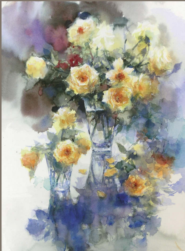
4 Yuko Nagayama