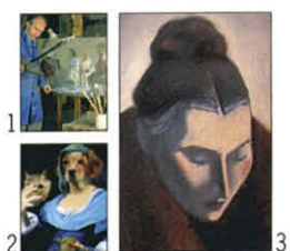
En couverture : 1. Huile sur papier, marouflé sur bois Antoine Vincent 2. Cache-cache, acrylique Sylvia Karle-Marquet 3. Marie-Alice, pastel sec Mariano Otero