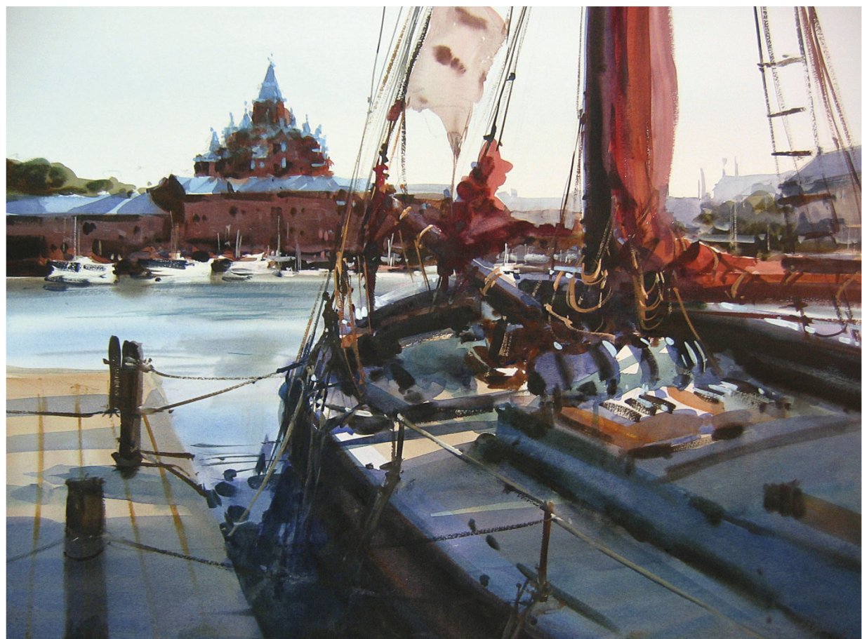
Helsinki. 2008. 54 x 74 cm.

« Toutes mes peintures en plein air ont été réalisées en moins de 90 minutes. Je considère qu'après ce temps, tout ajout est obsolète et n'améliorera en aucun cas votre peinture. »