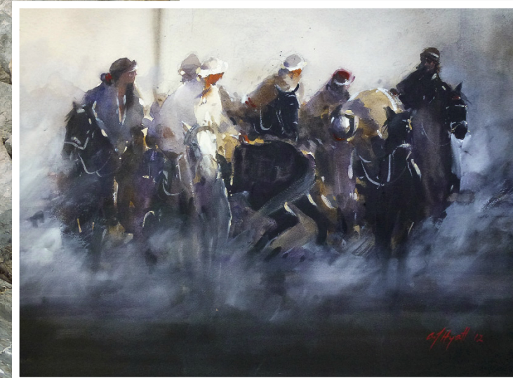
The White Horse of the Buzkashi. 2012. 54 x 74 cm.

Elle est membre de la très convoitée Twenty Melbourne Painters Society, une société presque centenaire émanant de l'école d'Heidelberg et réduite à 20 membres sélectionnés.