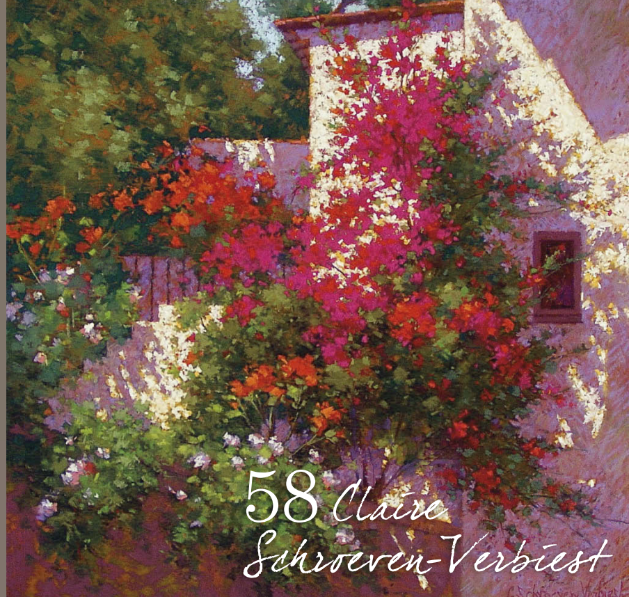
58 Claire Schroeven-Verbiest