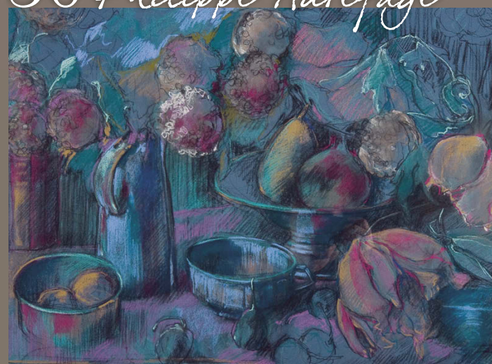
22 Lionel Asselineau