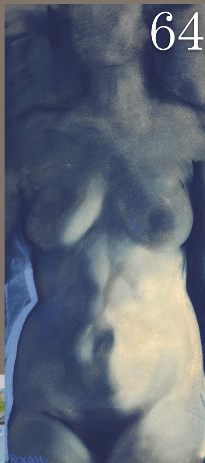
64 Jean-Pierre Rescan