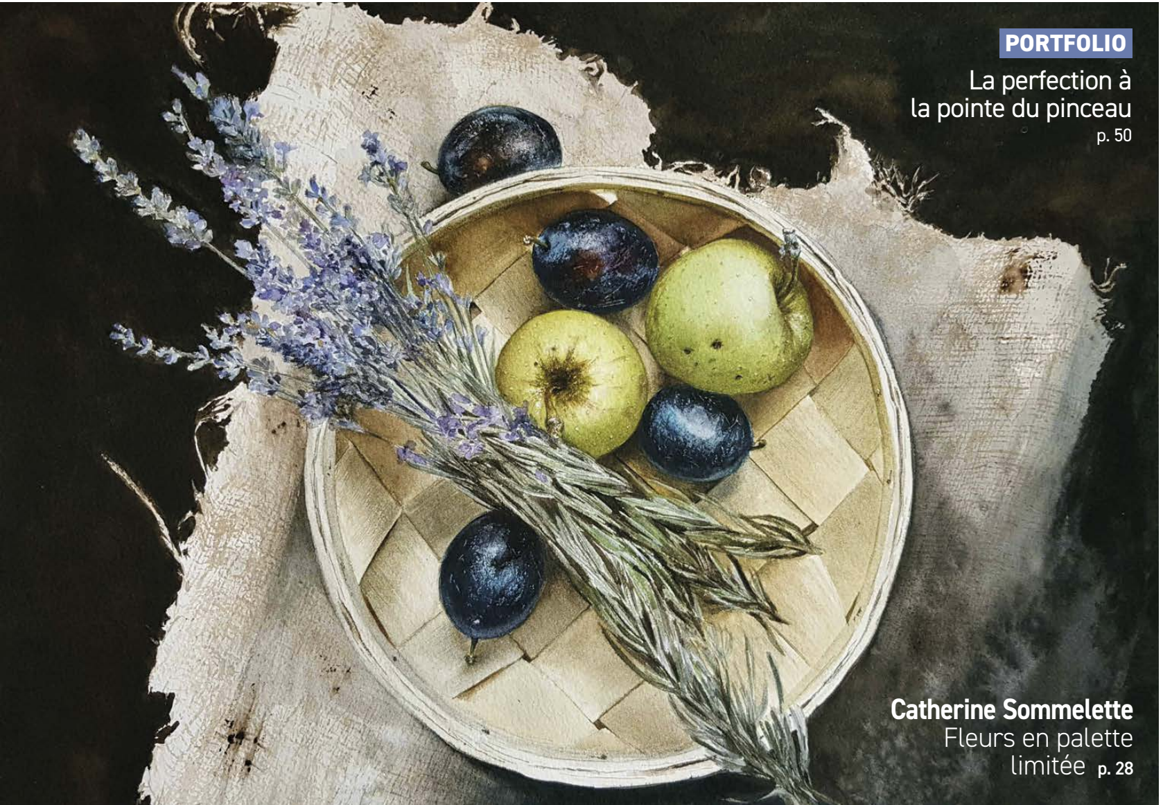
Catherine Sommelette Fleurs en palette limitée p. 28

La perfection à la pointe du pinceau p. 50