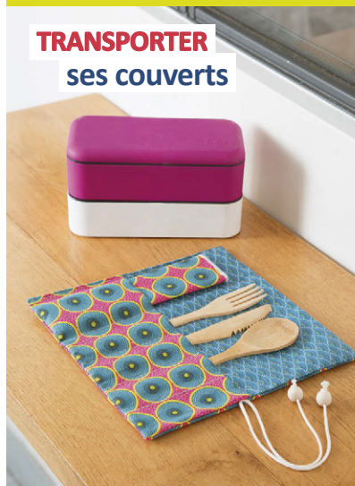
TRANSPORTER ses couverts