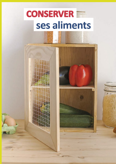
CONSERVER ses aliments