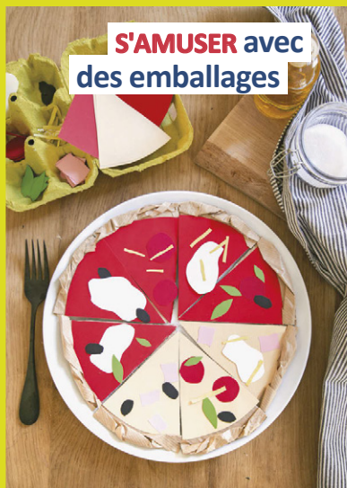
S'AMUSER avec des emballages