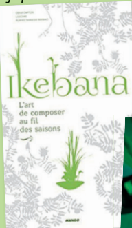
Un livre récent sur le sujet (novembre 2016).

Au mois de juillet, vous pourrez admirer des créations d'Ikebana aux Jardins des Martels.